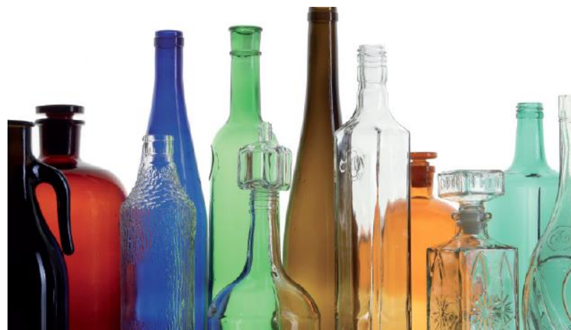
Emballage en verre