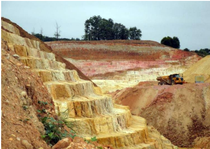
Carrière de Thédillac, Lot