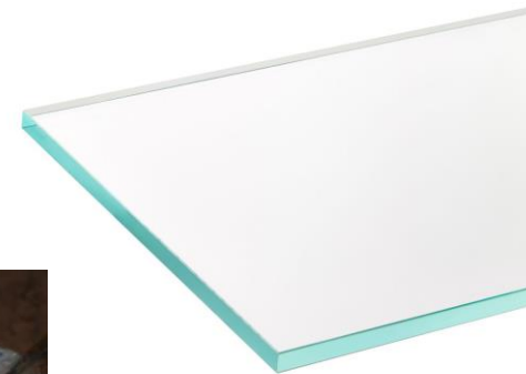
Verre plat