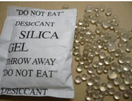
Gel de silice