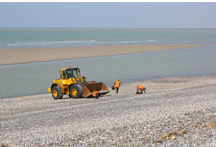
Ramassage à la main de galets de silex à Cayeux-sur-Mer