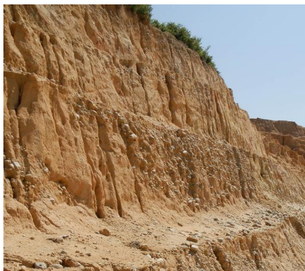
Galets de quartz exploités à Thédillac, Lot