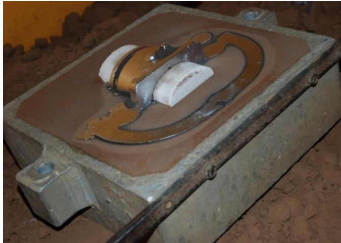
Moule de fonderie en sables siliceux