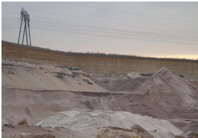
Sables de Beauchamp exploités à Rosières, Aisne