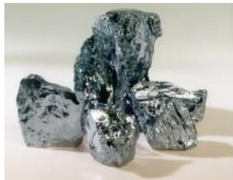
Silicium métal