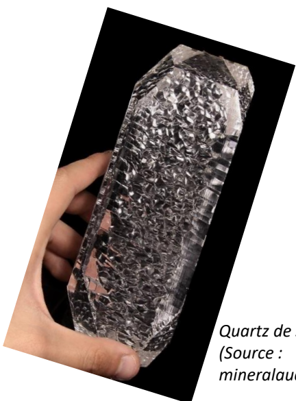
Quartz de synthèse